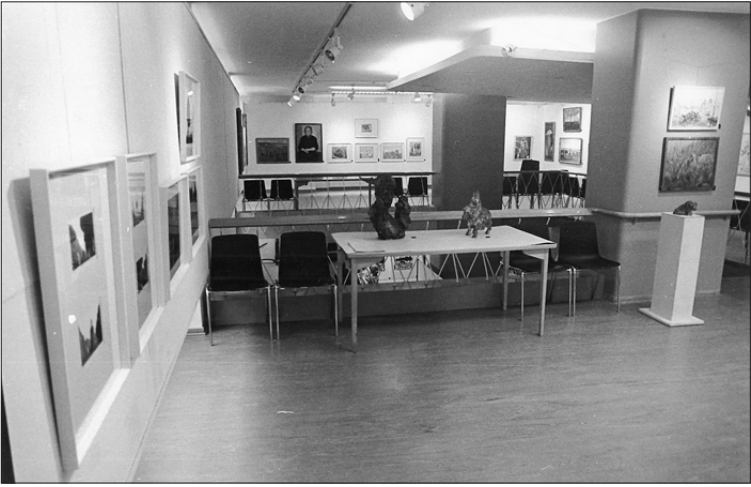
Museon vuosinäyttely XVIII, Vesitornin toinen kerros, kuvattu 15.10.1977.