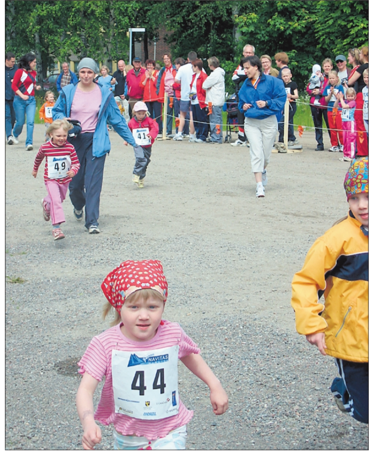
Kuvassa Junnumaratonin osanottajia viime vuodelta.

- Tämä on iso tapahtuma, joka ei onnistuisi ilman hyviä yhteistyökumppaneita ja innostunutta talkooväkeä, haluankin tässä yhteydessä kiittää heitä. Ilmoittautuminen on ollut jo tähän mennessä varsin vilkasta ja ennakoilmoittautumisia otetaan edelleen jatkuvasti vastaan. Ilmoittautua voi joko netissä osoitteessa www.navitasmaraton.com tai puhelimitse numeroon 040-705 8092, Kokkonen kertoo.