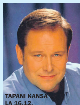
TAPANI KANSA LA 16.12.