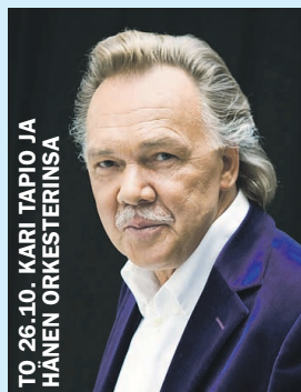
TO 26.10. KARI TAPIO JA HÄNEN ORKESTERINSA

- Suhtaudumme jokaiseen esiintymiseen vakavasti ja panostamme aina täysin voimin ja sieluin, jotta esitys sujuisi ikään kuin olisimme joka päivä olleet juuri kyseisellä näyttämöllä ja jotta yleisö uskoi esitykseen.