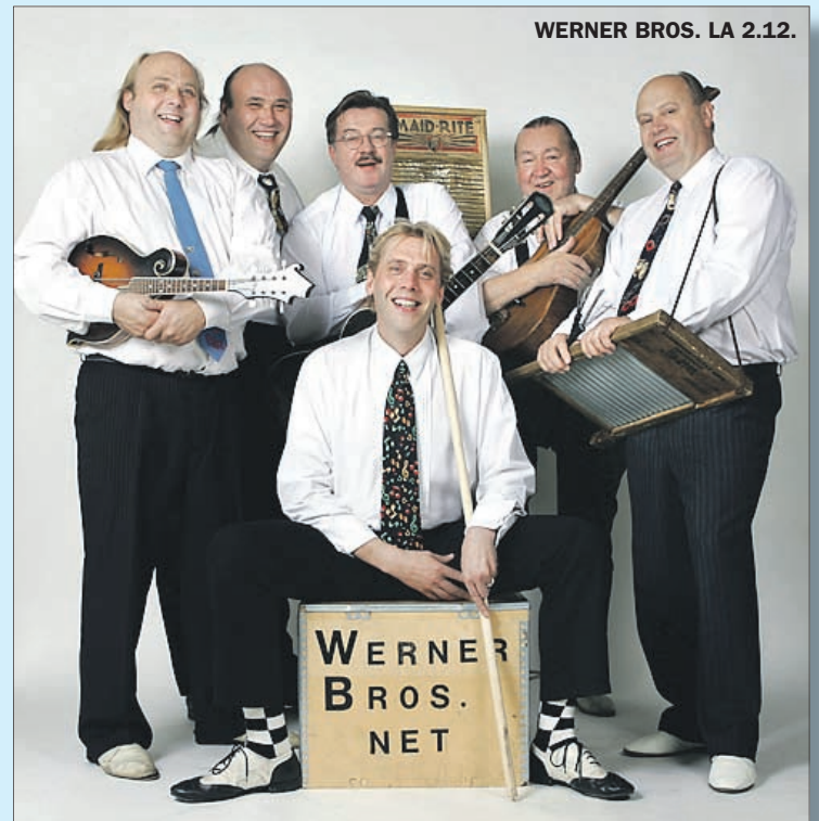
WERNER BROS. LA 2.12.