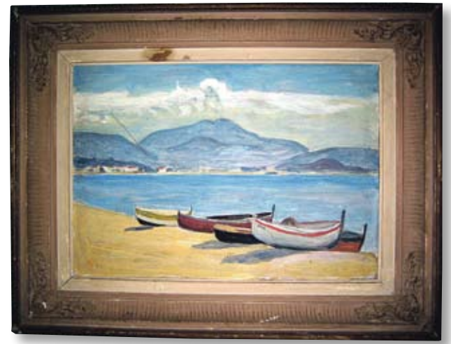
G. von Hueck Kalastajien parkkilaivoja Nizzassa, Barques de pêcheurs à Nice, öljy kankaalle. Varkauden kaupungin kokoelma.