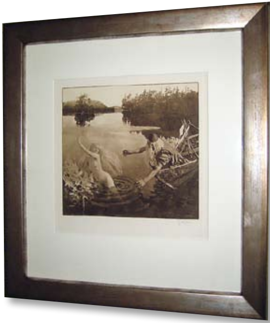
Painojäljennös Akseli Gallen-Kallela (186-1931) Aino-taru, triptyykin keskiosan maalauksesta. Varkauden kaupungin kokoelma.