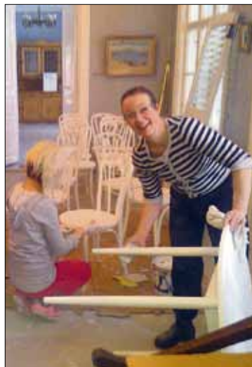
Siveltimellä ja maalilla pinnat siistiksi!

Ulkorakennuksenkin kimppuun käytiin. Varastokäytössä olevia tiloja raivattiin uusiokäyttöön. Kalastuksen perinnehuone, ns. Sältin huone ja Väentupa tulevat uudistumaan.