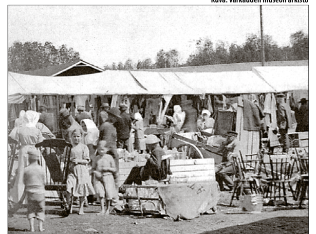
Kaupankäyntiä Päiviönsaaren torilla vuonna 1910.

Kuten jo aikaisemmin mainitsin, en käynyt muualla markkinoilla kuin omalla paikkakunnalla. Ystäväpiiris-